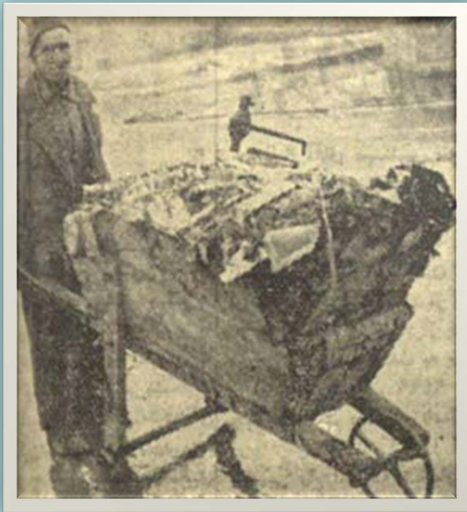
تصویر یک رفتگر روزنامه اطلاعات ۱۳۳۶